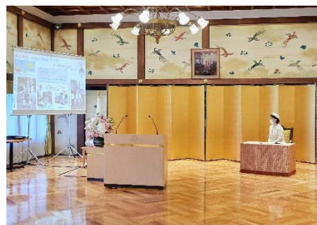
受賞者（保健師）活動紹介