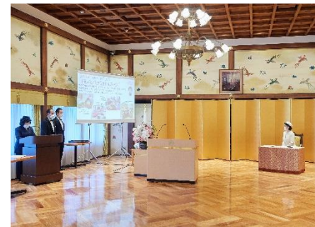
受賞者（愛育班員）活動紹介