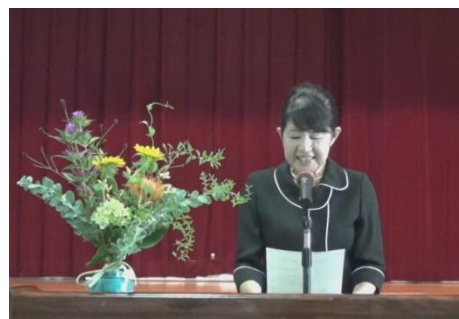
手記優秀作発表（ビデオ朗読）