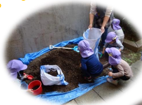
土を耕し、肥料を与えました