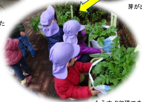
もうすぐ収穫できそうだ